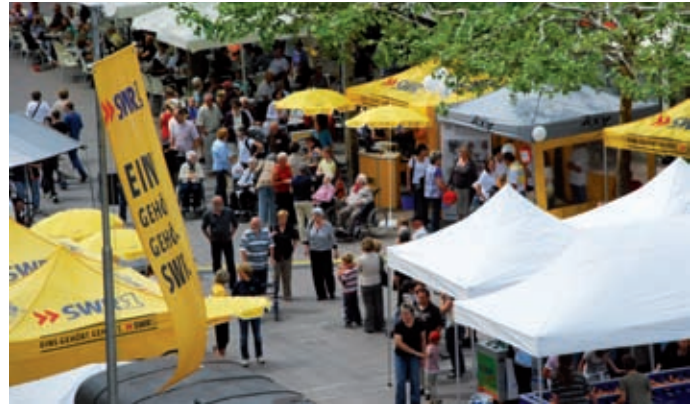
Bei der SWR 1 Ferien-Tour 2010 war der Marktplatz eine große Festmeile.